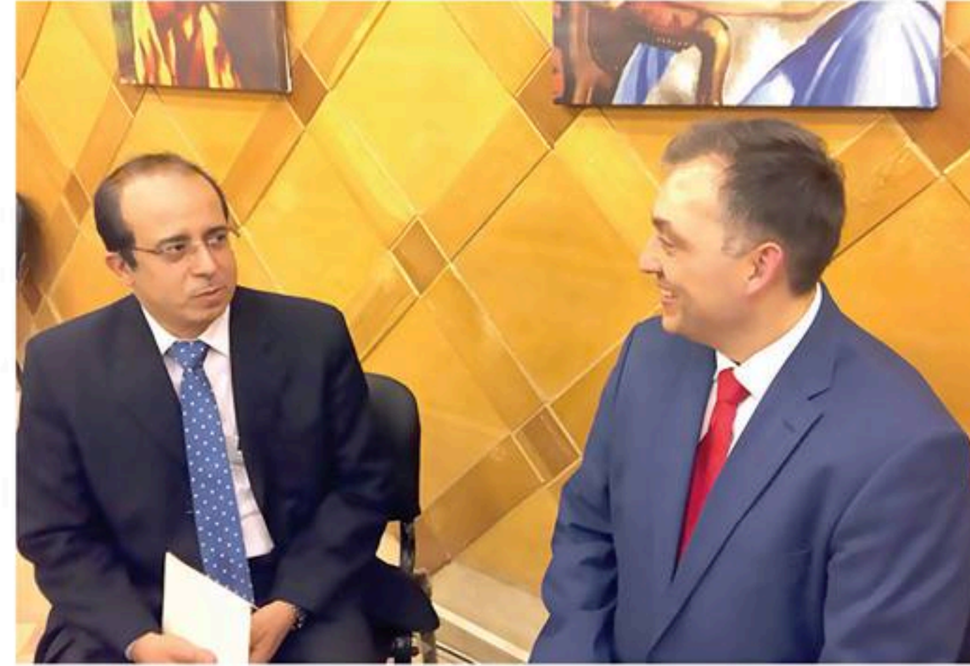
حفيد الملك فاروق مع محرر الاخبار المسائي